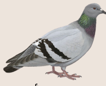
حمام مستأنس Feral Pigeon