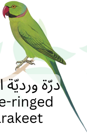
درّة وردية الطوق Rose-ringed Parakeet