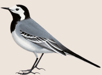
ذعرة بيضاء White Wagtail