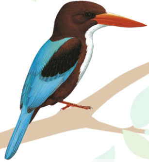
صيّاد السمك ابيض الصدر White-throated Kingfisher