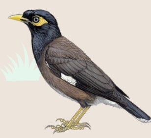
مينة شائعة Common Myna