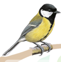
قرقف كبير Great Tit