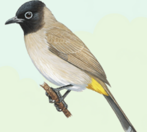
بلبل أصفر العجز Spectacled Bulbul