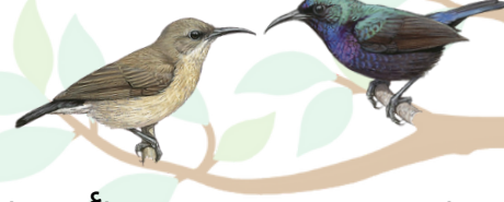
تمير فلسطين (أنثى) Palestine Sunbird