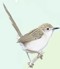
هازجة رشيقة Graceful Prinia