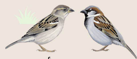
(ذكر) دوريّ (أنثى) House Sparrow