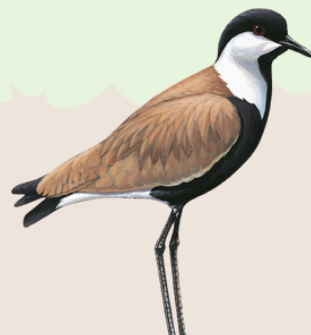
زقزاق مصريّ Spur-winged Lapwing