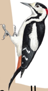
نقّار الخشب السوريّ Syrian Woodpecker