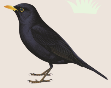
شحرور Eurasian Blackbird