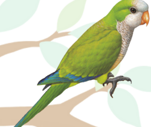
بيغاء الراهب Monk Parakeet