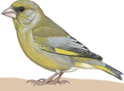
حسون أخضر Greenfinch