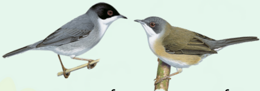
أنثى) دخلة رأساء (ذكر) Sardinian Warbler