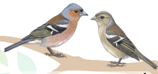
أنثى) حسون ظالم (ذكر) Chaffinch