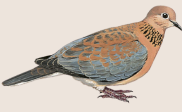
رُقطيّة Laughing Dove