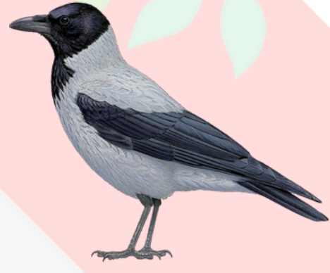
غراب رمادي Hooded Crow