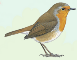
أبو الحناء Robin